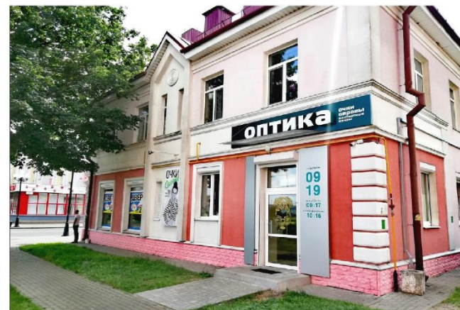
Панорамный вид здания

Для конструкций предусматривающих подсветку предоставляется ночной вид :